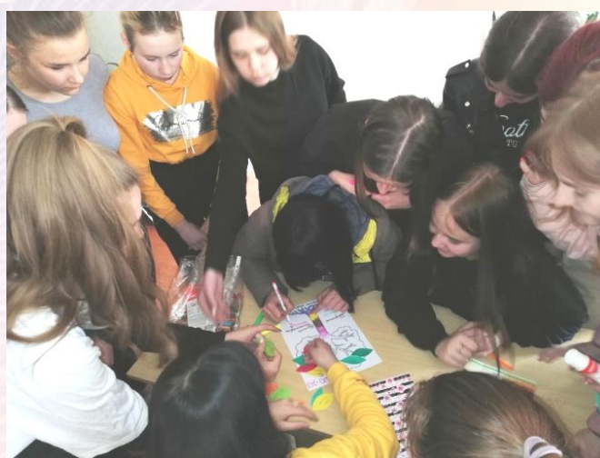
Волонтеры с учащимися учебных групп провели коворкинг-челендж «Семейное дерево»