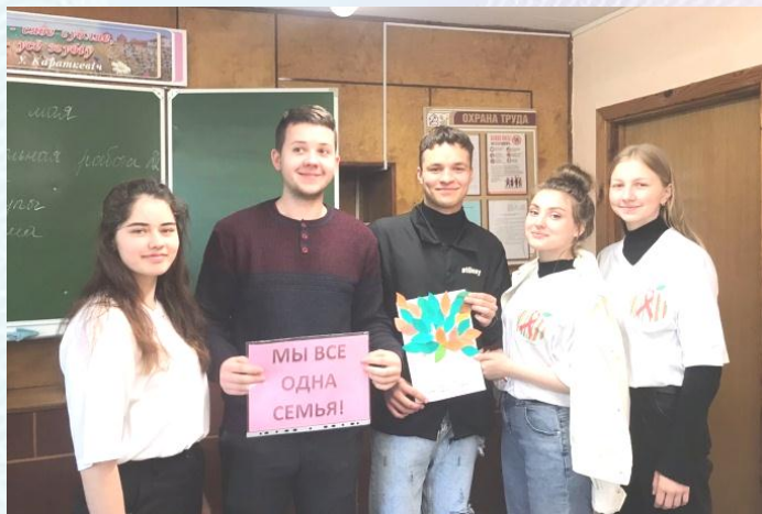
Активисты профилактического отряда «АЛЬТЕРНАТИВА» предлагали ребятам информ-дайджест «Всё начинается с семьи», где рассказали о важности семейного института в обществе.

К Международному дню семьи в колледже прошел комплекс тематических мероприятий в рамках республиканской акции «Моя семья – моя страна».