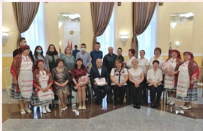
Крепка семья - крепка держава! Под таким тематическим названием состоялось мероприятие в Солигорском ЗАГСе, куда были приглашены и учащиеся нашего колледжа.