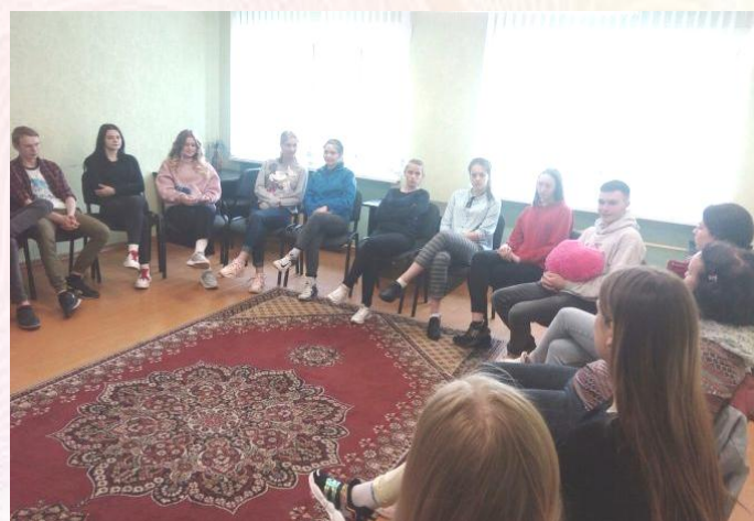
В нескольких учебных группах состоялись тренинги «Любовь. Семья. Здоровые отношения»